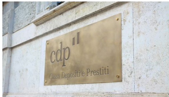
Prosegue il programma di emissioni di Minibond da 148 milioni di euro per supportare i progetti di crescita delle imprese campane. Cassa Depositi e Prestiti e Mediocredito Centrale anchor investor dell'operazione